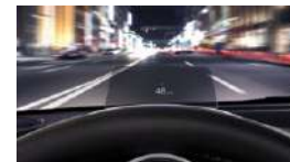
PANTALLA ACTIVA DE CONDUCCIÓN**