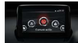
PANTALLA TÁCTIL TFT DE 7**