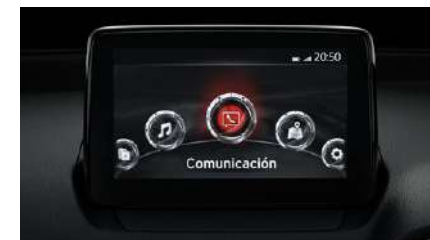
PANTALLA TÁCTIL TFT DE 7"