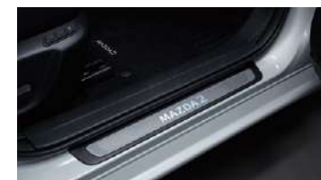
PISA ALFOMBRA ILUMINADO