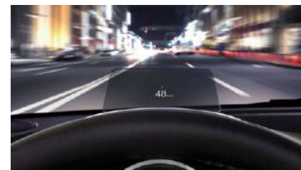
PANTALLA ACTIVA DE CONDUCCIÓN**